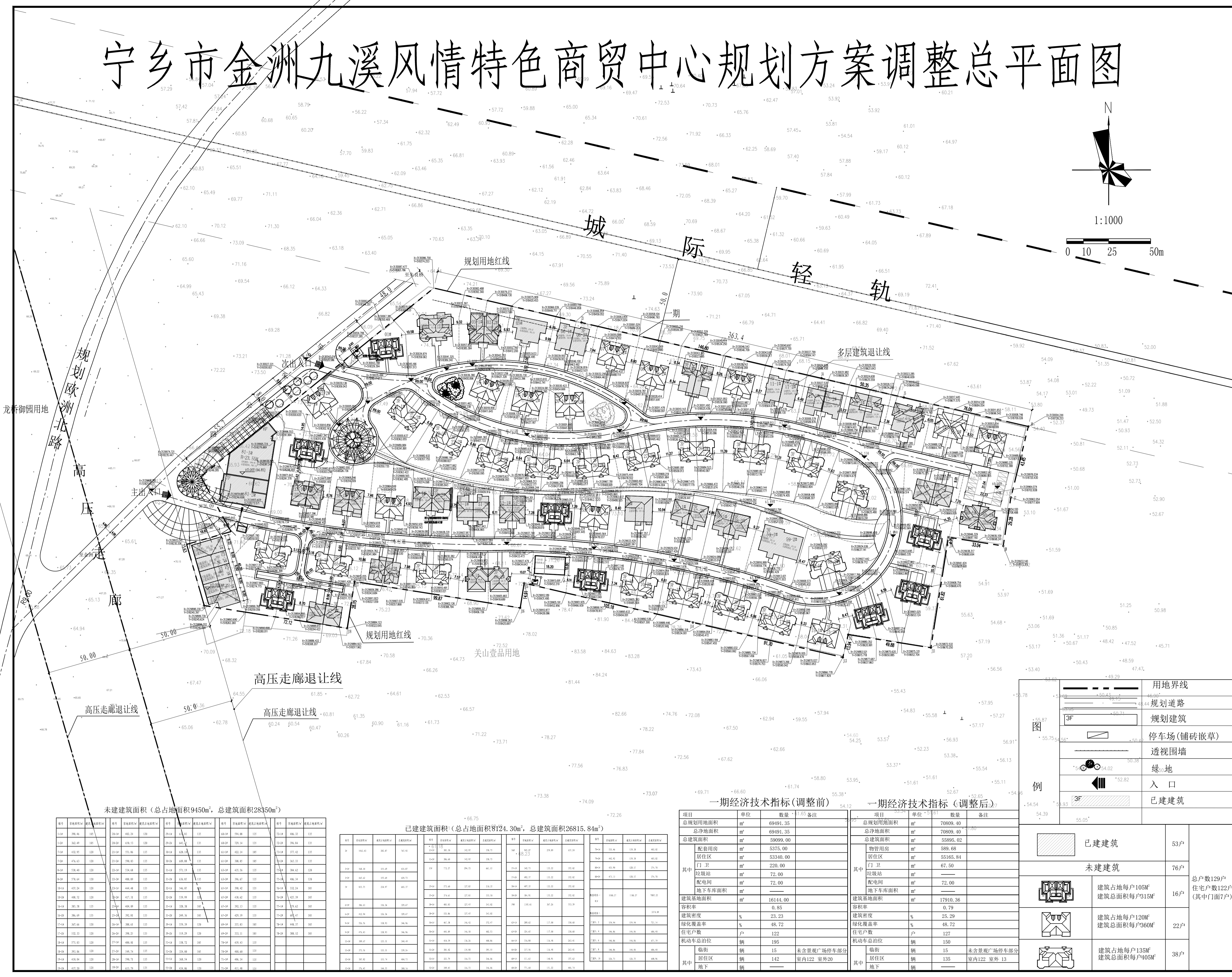
未建建筑面积 (总占地面积9450m 2 , 总建筑面积28350m 2 )